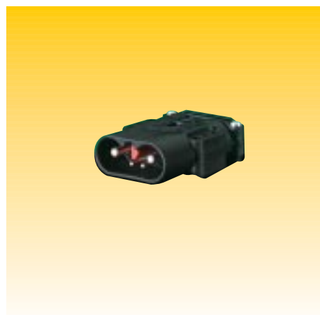
SPINA FT80 AMP. CON SERRACAPO PLUG FT80 AMP. WITH CABLE CLAMP

I contatti principali sono in rame elettrolitico argentato. The main contacts are made from electrolytic copper.