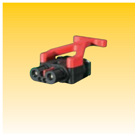
PRESA FT80 AMP. CON SERRACAPO SOCKET FT80 AMP. WITH CABLE CLAMP