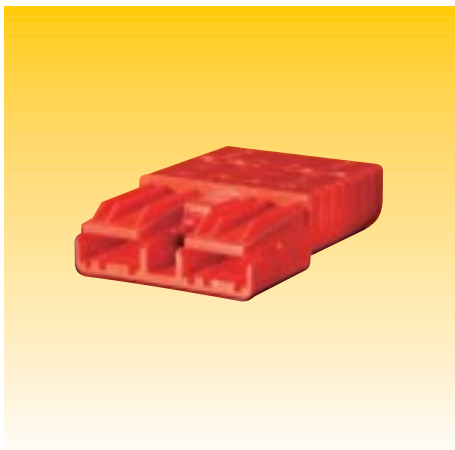
CONNETTORE SRE 320 CONNECTOR SRE 320