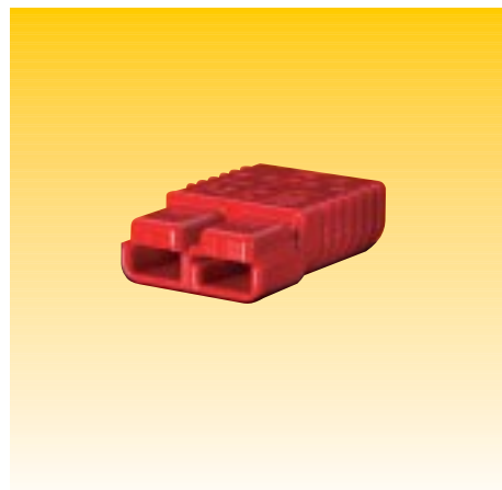
CONNETTORI SR 50, SR 175, SR 350 CONNECTORS SR 50, SR 175, SR 350

Altri accessori vedi SRE 320 - Other accessories see SRE 320