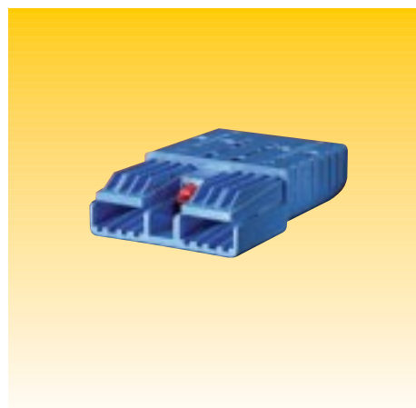
CONNETTORI SRX 350 CONNECTORS SRX 350