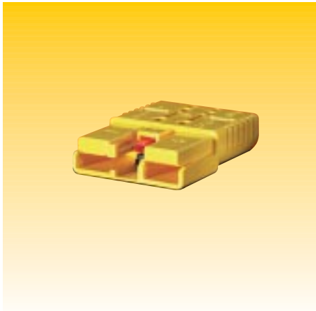
CONNETTORE SRE 160 CONNECTOR SRE 160